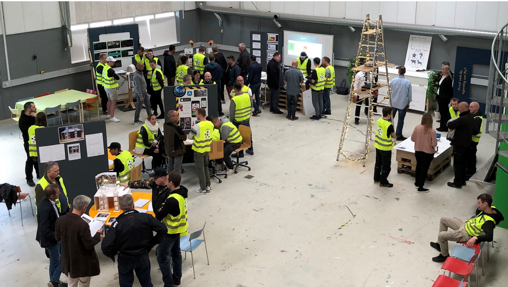
Innovationscamp på transportuddannelserne på TEC.