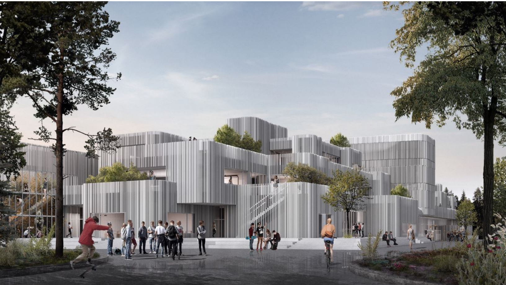
Visualisering af H.C. Ørsted Gymnasiet, lavet af KANT Arkitekter.