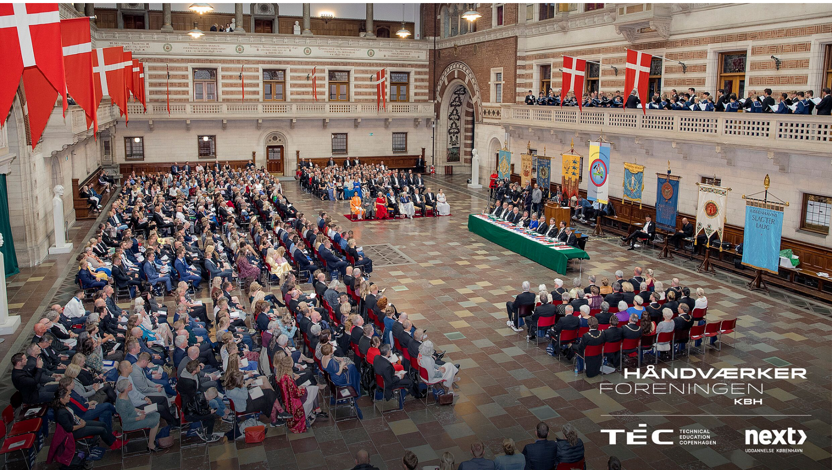
Medaljefest på Københavns Rådhus 14. maj 2019