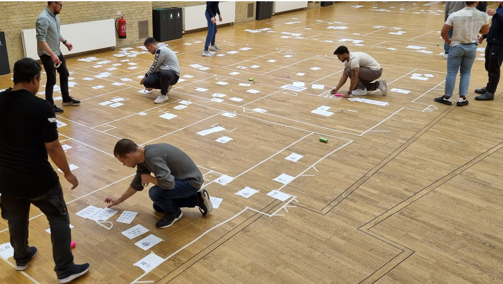
Elektrikerelever arbejder med KNX i aulaen på TEC på Frederiksberg