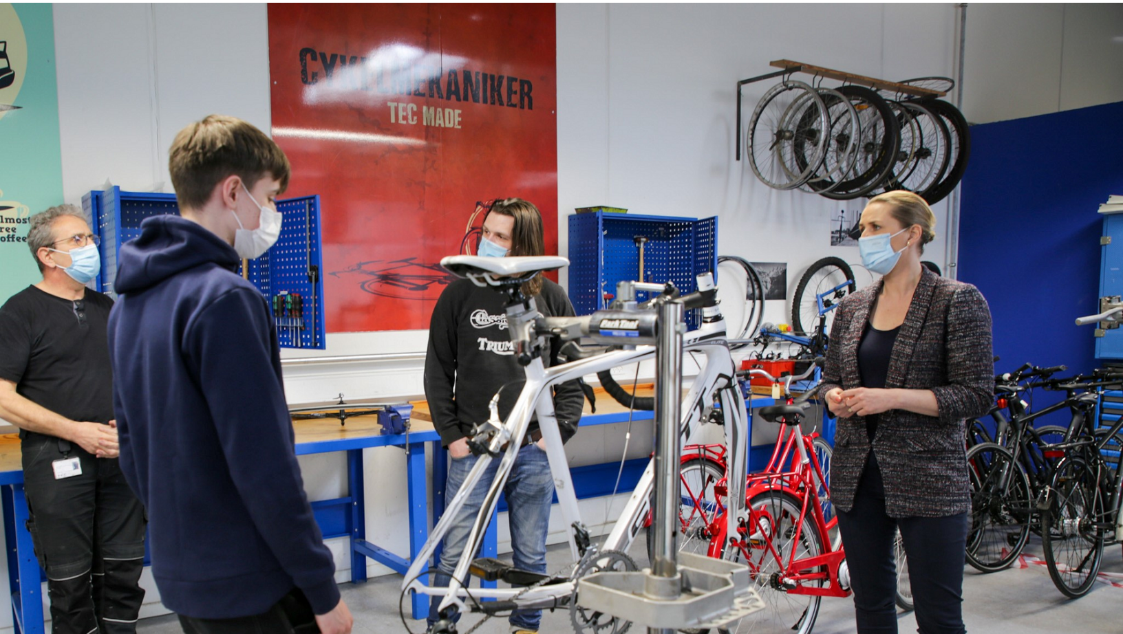
Statsminister Mette Frederiksen på besøg på TEC i Hvidovre.