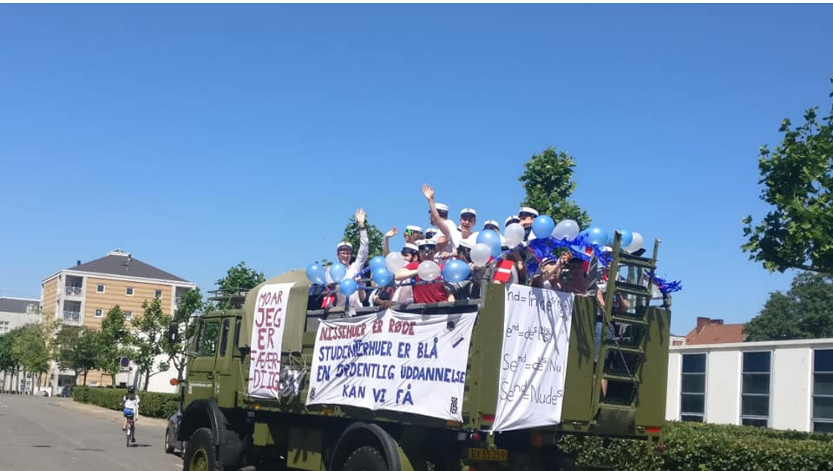
Glade studenter fra H.C. Ørsted Gymnasiet på Frederiksberg i 2019.