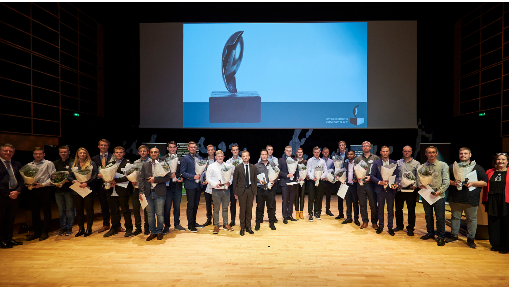
Alle 25 prismodtagere